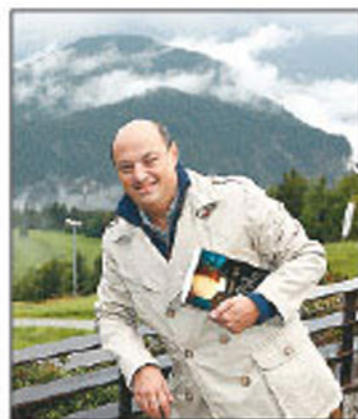
El escritor Eric Frattini