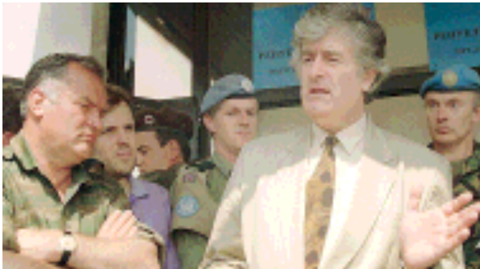
Gli ex leader dei serbi-bosniaci Radovan Karadzic e, a sinistra, Ratko Mladic SERVIZIO A PAGINA 15