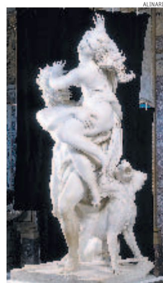
Originale. Il Ratto di Proserpina di Bernini alla Galleria Borghese

ha ben prestato dei pezzi pregiati all'emiro di Abu Dhabi. E col federalismo fiscale Roma non ha forse conquistato il diritto di gestirsi i propri tesori come meglio crede? Pensiero stupendo. Ma perché limitarsi ai magazzini. Suvvia, un po' di coraggio: estendiamo il progetto anche alle opere in esposizione. Invece di abbandonarle alla neghittosità dei custodi (peraltro già nella lista nera di Brunetta), diamole in leasing alle famiglie italiane, che restano le istituzioni più solide e affidabili della Repubblica. Dopo la casa per tutti, un capolavoro in ogni casa. Pagabile in comode rate mensili. Già ci pare di sentire le